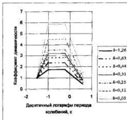
Рис. П.3.1. Спектры коэффициентов динамичности для различных логарифмических декрементов колебаний \delta